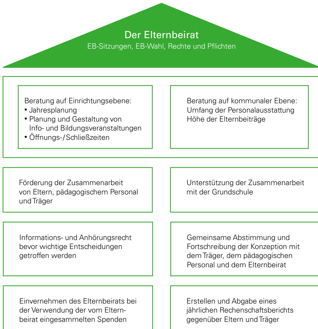
Übersicht „Der Elternbeirat“

Die Aufgabenbereiche des Kindertageseinrichtungsbeirates sind in Artikel 14 des Bayerischen Kinderbildungs- und -betreuungsgesetzes (BayKiBiG) geregelt.